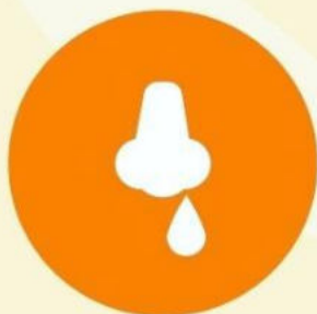
Мұрыннан қан кету