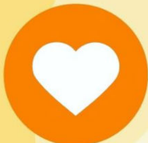
Страдающие заболеваниями сосудов и сердца