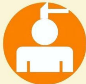
Қатты бас ауруы