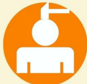
Сильные головные боли