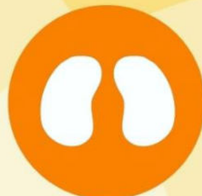
Страдающие заболеваниями желез внутренней секреции