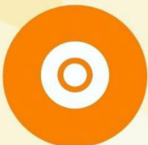
Көз қарашығының кеңеюі